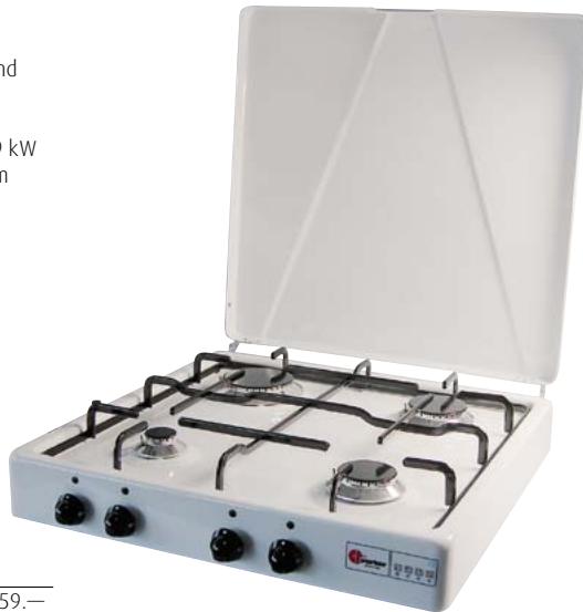
720.2095 Rechaud MVB-4 weiss 359.—