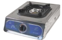
720.2104 Rechaud Jove Uno 147.—