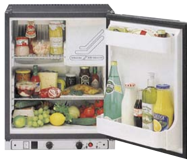
746.4203 Kühlschrank Dometic RM 4203 1175.— 1)