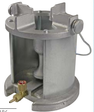
734.3570 Industriekocher A 472 186.—