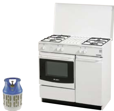
723.2652 Kochherd ELBA 58-225 WS 935.—