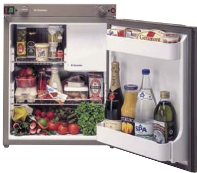
746.4220 Einbaukühlschrank Dometic RM 4210 1100.— 1)