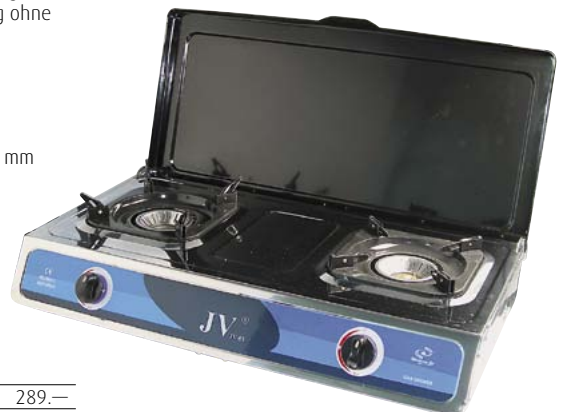
720.2105 Rechaud Jove Duo 289.—