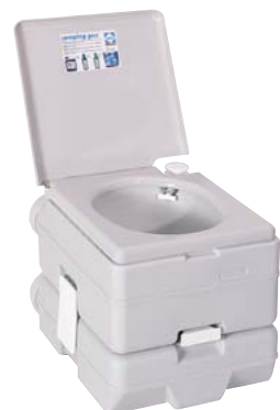
780.68272 EURO-WC Platinum Typ L 195.—