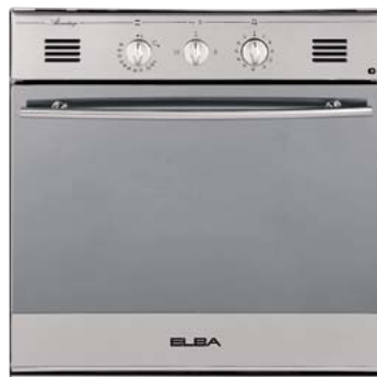
723.2564 Einbau-Backofen ELBA CE 500-621 X 838.—