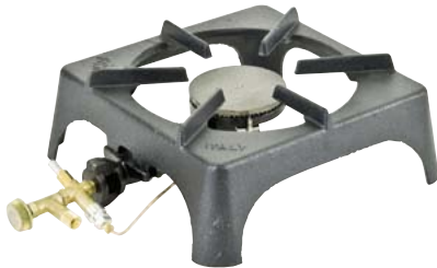
720.2146 Mit Zündsicherung 125.—