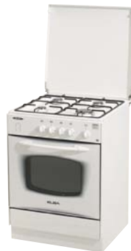
723.2661 Propan-Ausführung 998.— 723.2661.5 Erdgas-Ausführung 1055.—