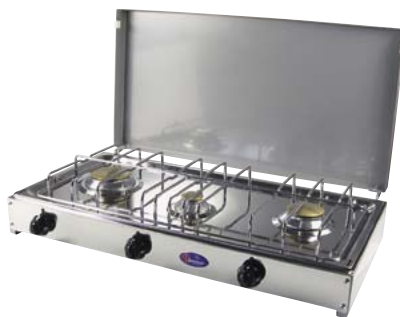
720.2031 Rechaud Trio 233.—