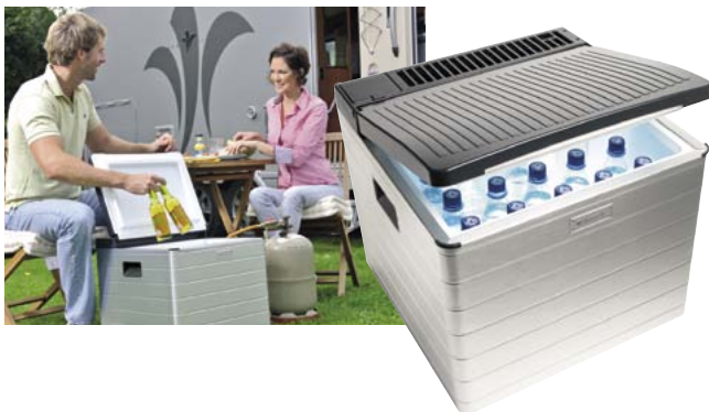
747.1027 Kühlbox RC 2200 EGP 498.— 1)