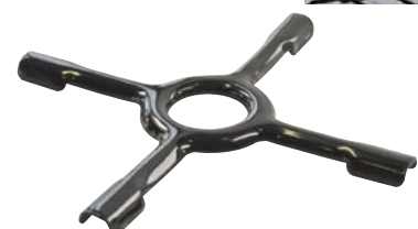
723.2668 Zusatzgitter 9.—