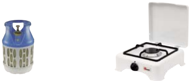
720.2045 Rechaud Solo 100 weiss 98.—