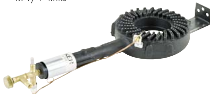
720.2316 Ringbrenner FOKER 121.—