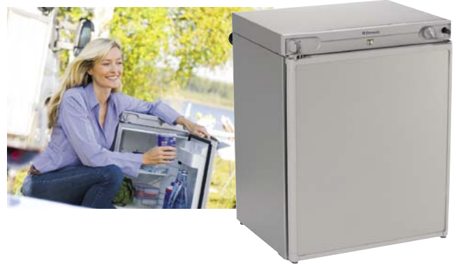
747.1025 Kühlbox RF 60 598.— 1)