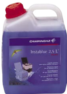
780.69950 Instablu Standard Sanitär Fluid 19.—

Wirkt desinfizierend und verhindert Geruchs- und Gasbildung. Spezielle Tenside fördern die Auflösung des Abfalls. Flasche à 2,5 l (ausreichend für ca. 18 Füllungen).