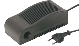
747.1021 Transformator 230 V – 12 V 45.— 1)

Für den Anschluss von thermoelektrischen 12-V-Kühlgeräten an 230 V.