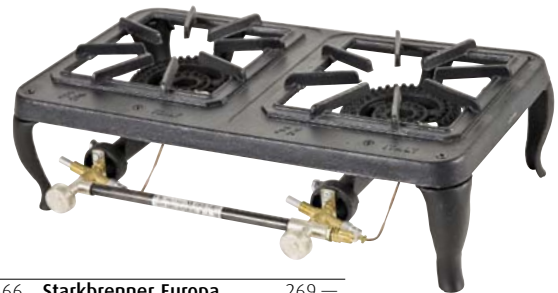
720.2366 Starkbrenner Europa 269.—