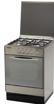
723.2663 Propan-Ausführung 1113.— 723.2663.5 Erdgas-Ausführung 1175.—