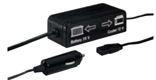
747.1012 Transformator 24 V – 12 V 74.— 1)

Im Zuleitungskabel integrierter Gleichstrom-Wandler für den Anschluss von 12-V-Kühlgeräten an 24 V.