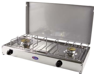
720.2021 Rechaud Duo 181.—