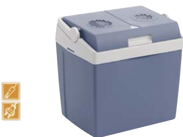
747.1022 Kühlbox T26 DC/AC 135.— 1)