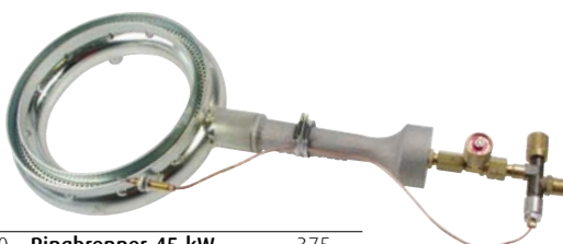
720.2470 Ringbrenner 45 kW 375.—