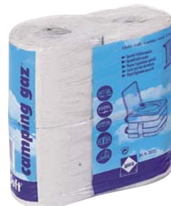
780.69961 WC-Papier EURO-Soft 9.90

Spezial-WC-Papier für Spül-Toiletten. Das Papier löst sich im Abfalltank vollständig auf. Inhalt 4 Rollen à 400 Blatt.