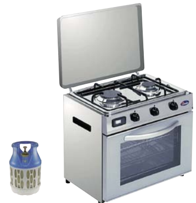
723.2451 Backofenkoher PARKER 698.—