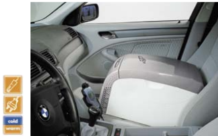
747.1018* MyFridge MF-18 Digital 235.— 1) *solange Vorrat