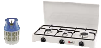
720.2065 Rechaud Trio 300 weiss 215.—