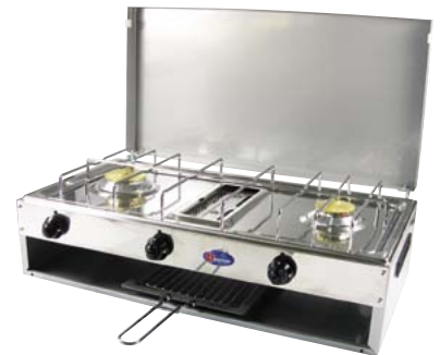
720.2022 Brenner Duo mit Grill 245.—