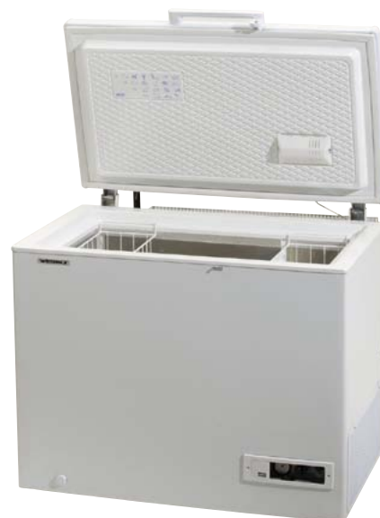
747.0210 Tiefkühltruhe CNG-210 4995.— 1)