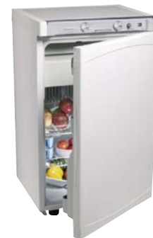
746.2000 Kühlschrank Dometic RGE 2000 1695.— 1)