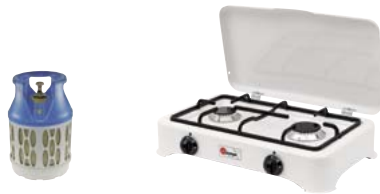
720.2055 Rechaud Duo 200 weiss 159.—